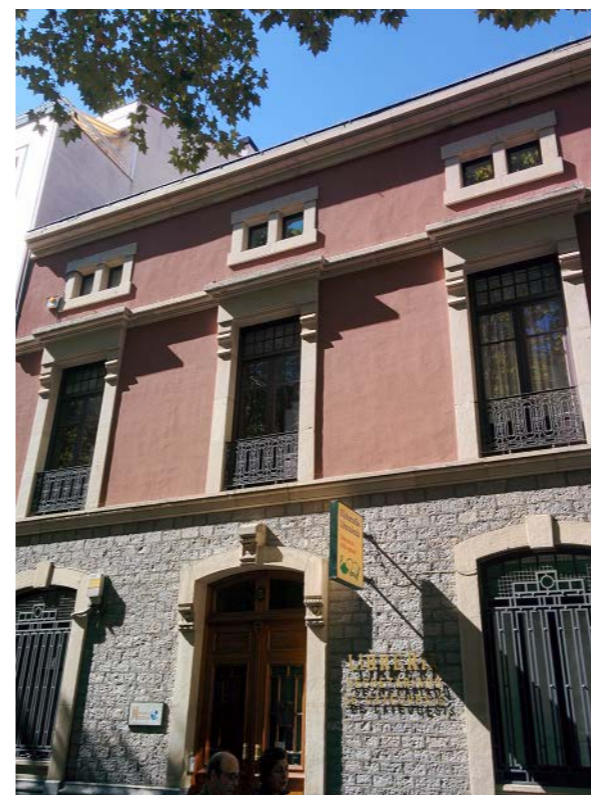
Sozial Eskolak hausnarketaren eremua izan nahi du, elkarrizketa eta soziopolitiko heziketa.

Sus acciones están centradas en la Escuela Social y en sensibilizar en cuestiones laborales realizando diversas actuaciones, además de otras actividades que sería prolijo señalar.