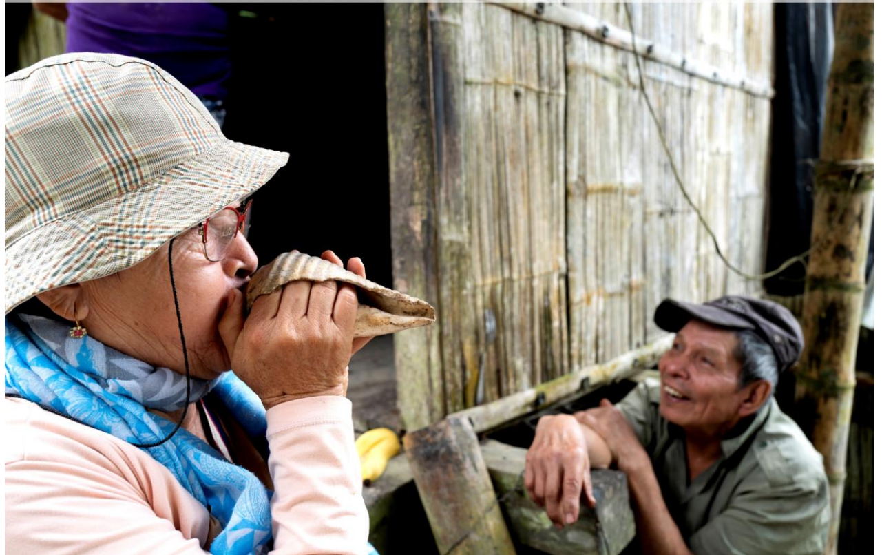
LLAMANDO CON EL CHURO A LOS TRABAJADORES AL ALMUERZO