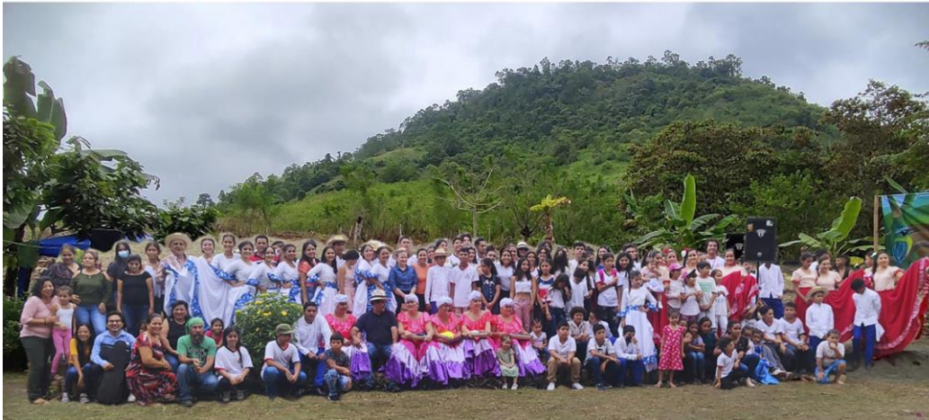
DESPUÉS DEL FESTIVAL MONTUBIO DEL 9 DE OCTUBRE, LA FOTO DE FAMILIA