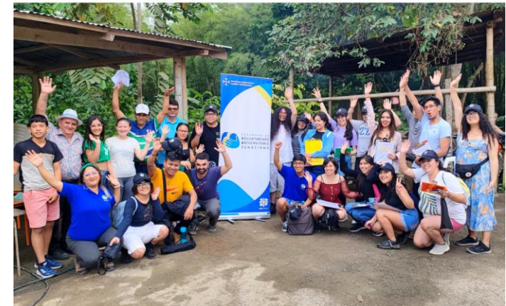
GRUPO DE ESTUDIANTES DE LA PUCE (Universidad Católica de Quito), DESPUÉS DE REALIZAR LA RECOGIDA DE HISTORIAS DE VIDA DE PERSONAS MAYORES EN PIQUIGUA, JUNTO A JÓVENES Y MIEMBROS DE LA COMUNIDAD