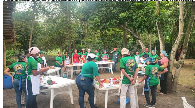
GUIAS DE TURISMO EN UN TALLER DE GASTRONOMIA, CON PROFESORES DE LA UNESUM (Universidad Estatal del Sur de Manabí)