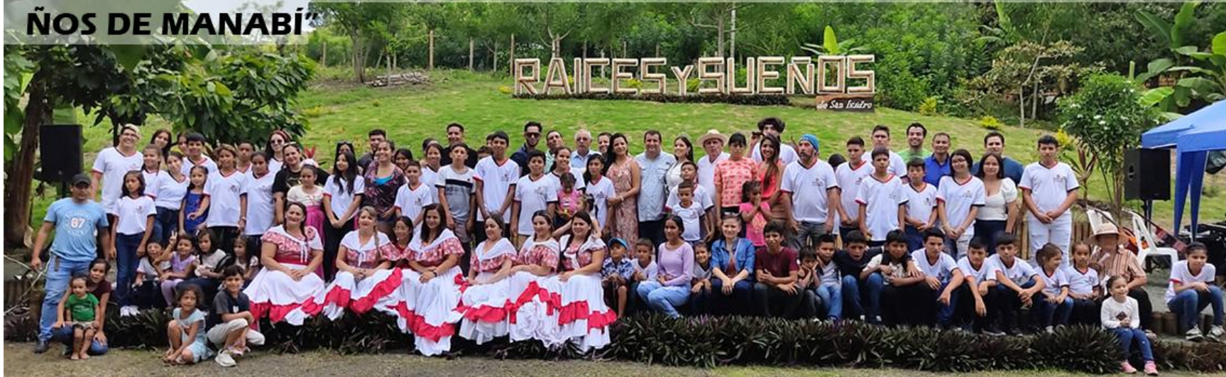
FOTO DE FAMILIA, DESPUÉS DE LA CONVIVENCIA DE 19 DE ABRIL DE 2023, CON LA PARTICIPACIÓN DE AUTORIDADES LOCALES Y PROVINCIALES, DONDE SE SUBSCRIBIÓ EL COMPROMISO DE SER “RAÍCES Y SUEÑOS DE MANABÍ”

Raíces y Sueños no es una isla enclavada en las montañas de San Isidro. Es un sueño contagioso . Muchos, de dentro de San Isidro y de fuera, lo expresan diciendo: “Me he enamorado de este proyecto” . Así lo ratificamos en la firma colectiva que hicimos en la convivencia artística invernal del 19 de abril de 2023 , en presencia de autoridades locales y provinciales : “Aspiramos a ser Raíces y Sueños de Manabí” .